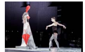
"El maniquí de la plaza" Nocheblanca.Bilbao.06.2011